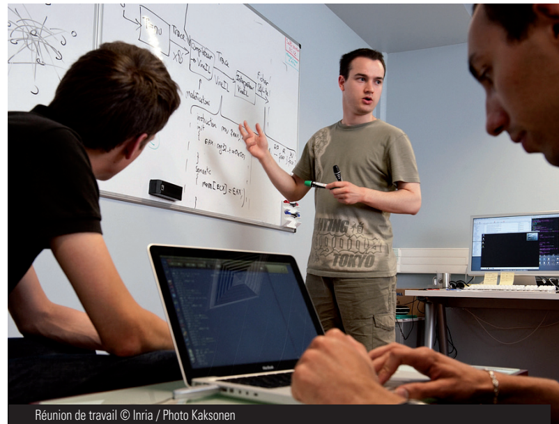
Réunion de travail

Depuis la rentrée 2021, le département Informatique propose une préparation au concours de l'agrégation externe d'informatique. Cette formation s'appuie sur un programme ambitieux, abordant de multiples facettes de l'informatique : architecture des ordinateurs, systèmes d'exploitation, réseaux, compilation, programmation avancée, intelligence artificielle, fondements théoriques de la discipline, sans oublier certaines questions sociétales majeures comme la gestion des données privées et l'impact environnemental.